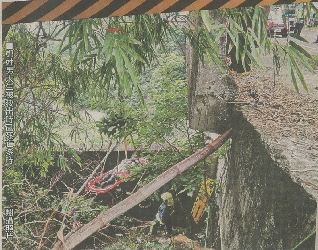
鄭姓男大生被救出時已死亡多時。

彰化縣警局說，139縣道山區路段，平均每月19.9件交通事故，今年增加至22.6件，近3成自摔或自撞，將研議增設方向桿及加強巡邏。