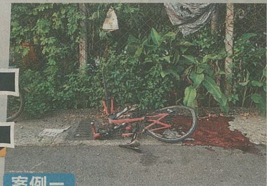
倪姓交大生在139線騎單車時，遭轎車撞飛當場死亡。資料照片

彰化139縣道大彰路段近期共發生4起重大交通事故，分別發生在八卦山路段的19.5、20、21及30公里處。